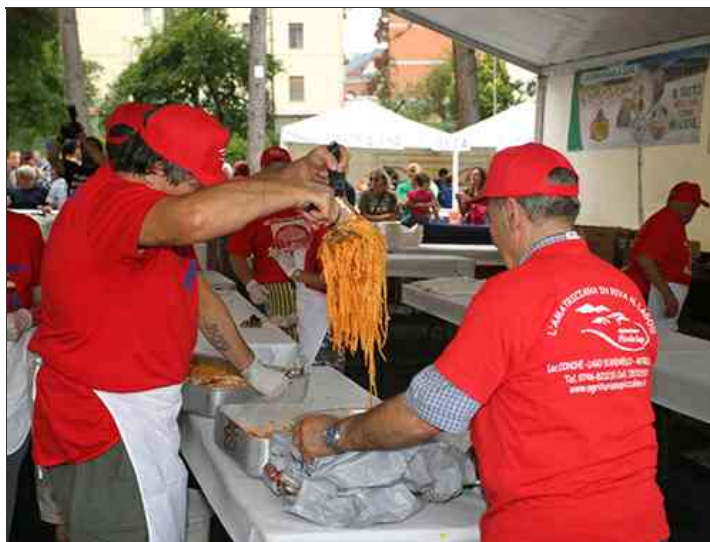
La sagra degli spaghetti all'amatriciana

“iniziata nel nome della lotta per il Grifoni la 48^ sagra degli Spaghetti all'amatriciana”