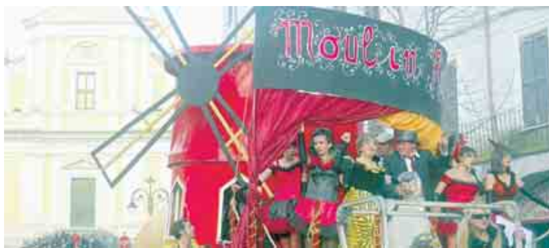
Torna a Poggio Mirteto la storica sfilata dei carri allegorici