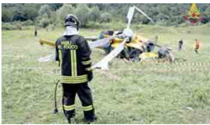
L'elicottero che precipitò al lago del Salto. Due le persone decedute

Fara Sabina La differenziata e i rimborsi spariti c'è la denuncia